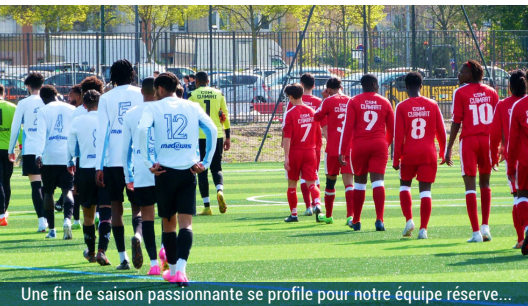
Une fin de saison passionnante se profile pour notre équipe réserve...